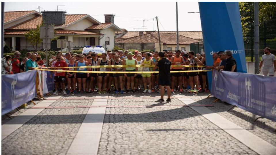
Fig.1 - Corrida Principal - Momento da partida