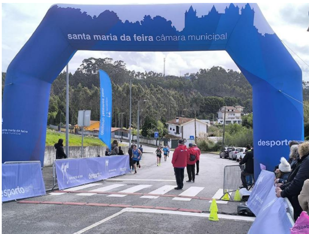
Figura 1 - 24º Grande Prémio de Atletismo