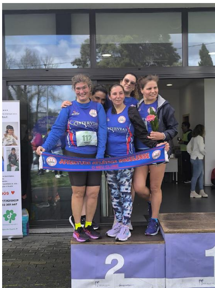
Figura 4 - 24º Grande Prémio de Atletismo