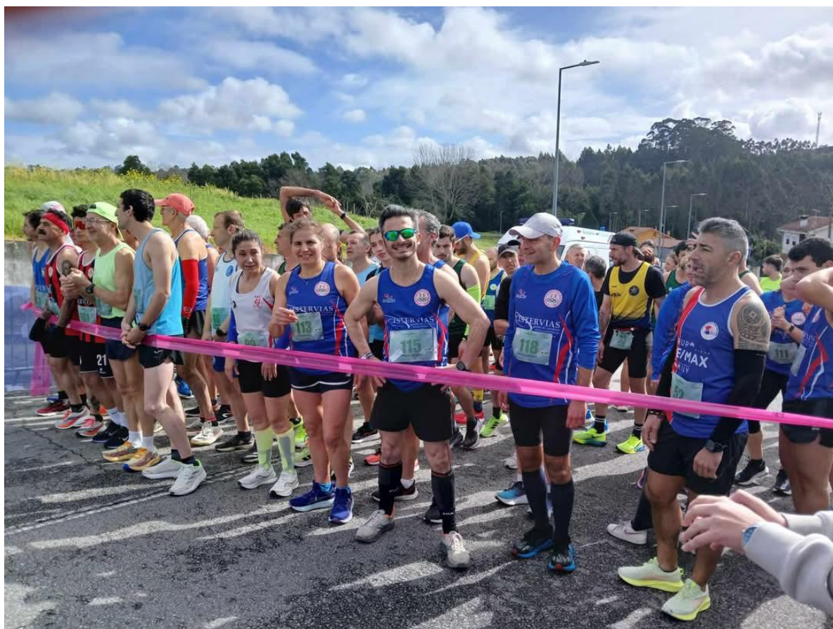
Figura 2 - 24º Grande Prémio de Atletismo