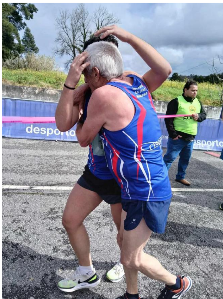
Figura 3 - 24º Grande Prémio de Atletismo; Fonte: Desconhecida