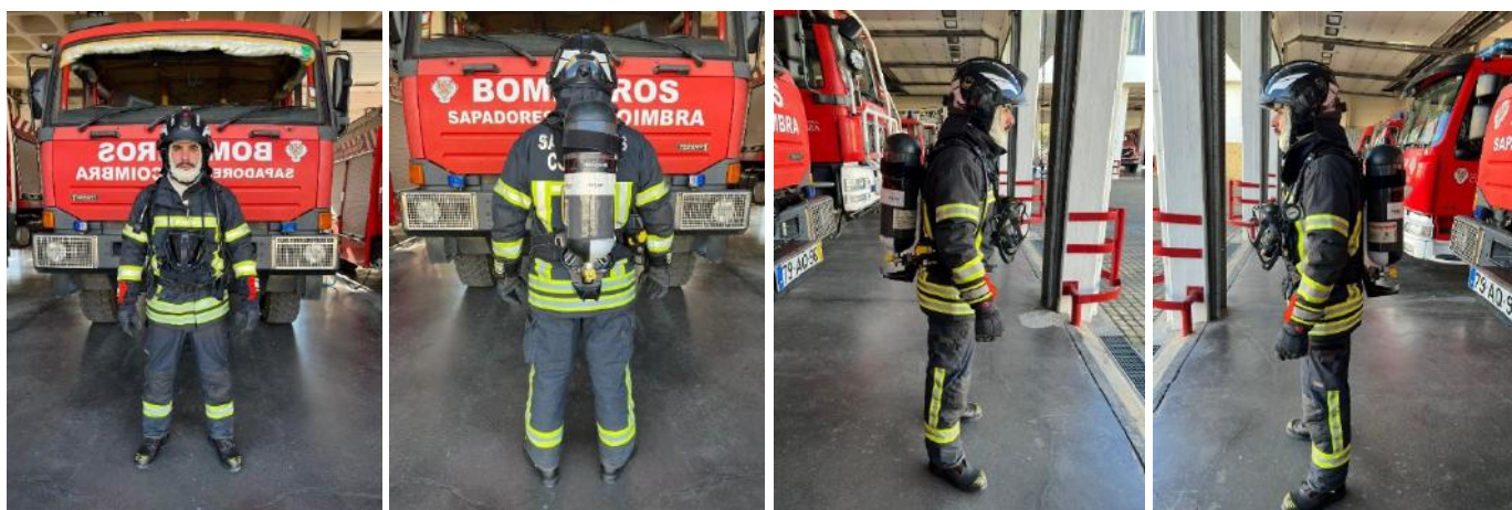
Figuras: Bombeiro pronto iniciar a prova.