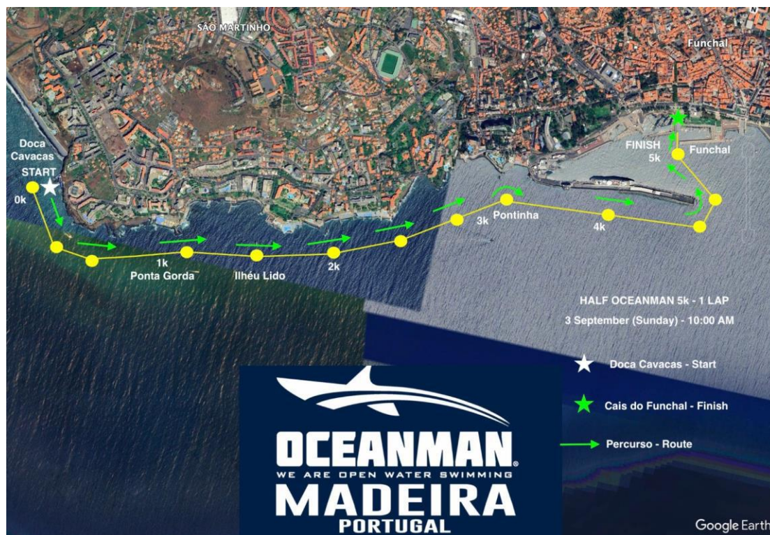
Imagem 3. Croqui – 5K HALF OCEANMAN

Associação de Natação da Madeira Instituição de Utilidade Pública – Resolução n.º 424/2012, de 12 de Junho de 2012