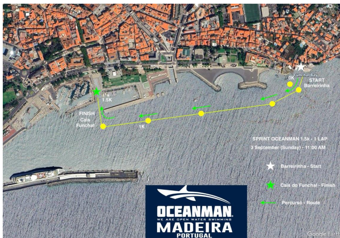
Imagem 5. Croqui – 1,5K SPRINT

Associação de Natação da Madeira Instituição de Utilidade Pública – Resolução n.º 424/2012, de 12 de Junho de 2012