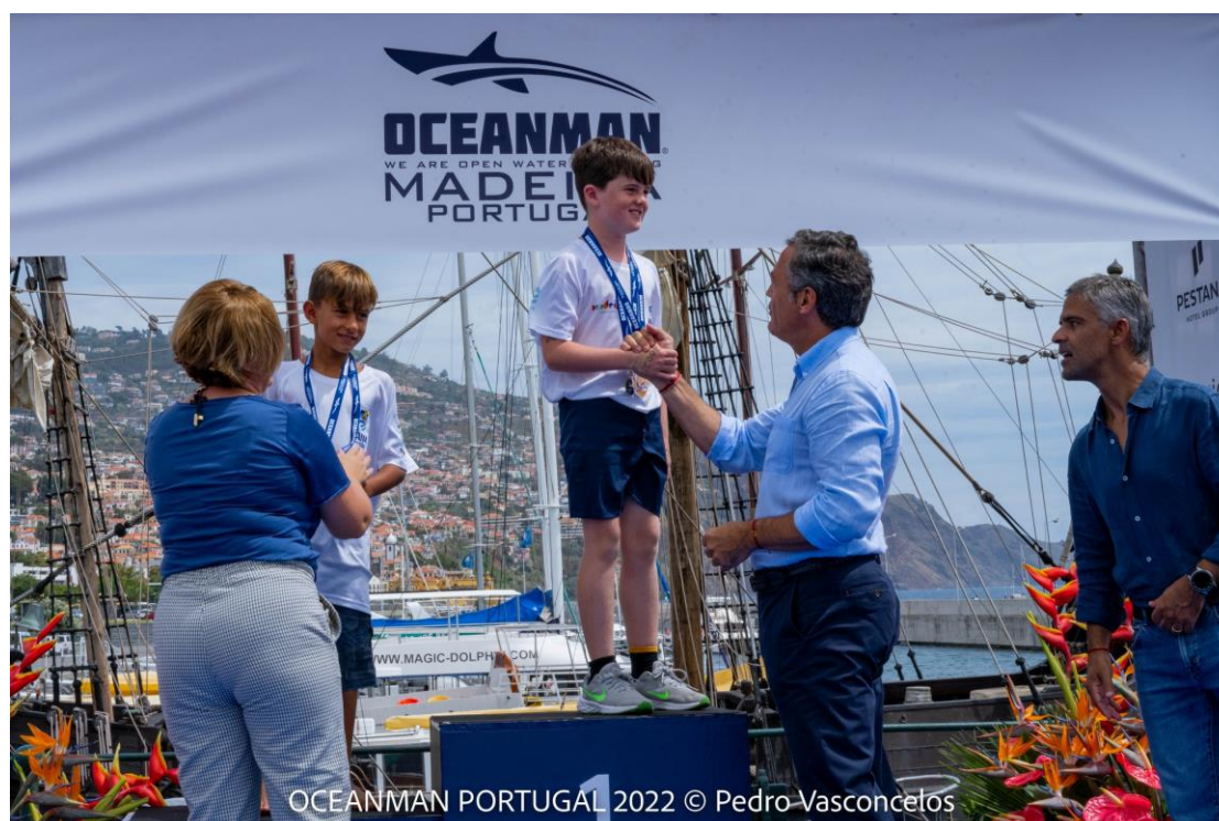
OCEANMAN PORTUGAL 2022

A CATEGORIA DO PARTICIPANTE É CALCULADA SEGUNDO A DATA EXATA DO TORNEIO. OU SEJA, PARTICIPANTES COM O MESMO ANO DE NASCIMENTO PODERÃO NÃO PERTENCER À MESMA CATEGORIA. – CRITÉRIO OCEANMAN