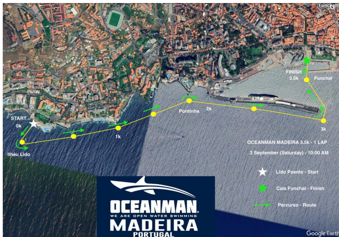
Imagem 4. Croqui – 3,5K OCEANMAN MADEIRA