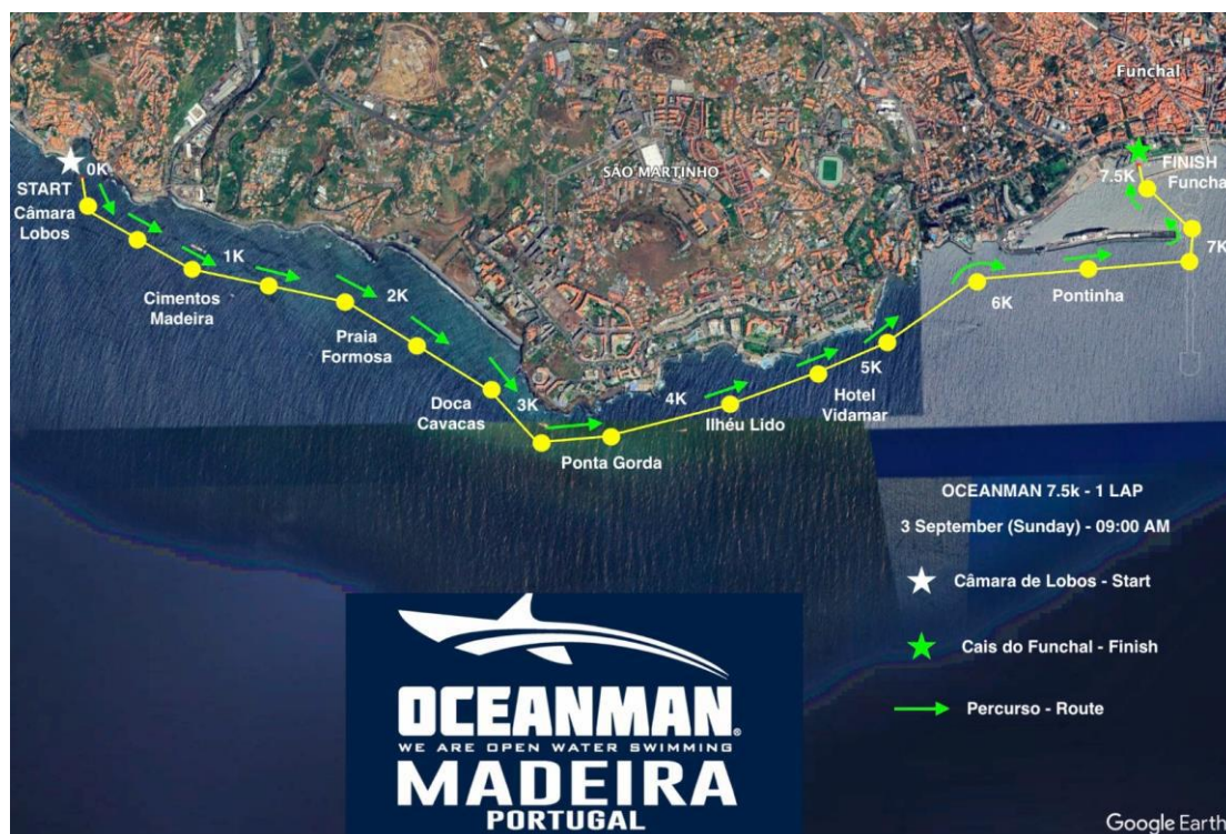
Imagem 2. Croqui – 7,5K OCEANMAN