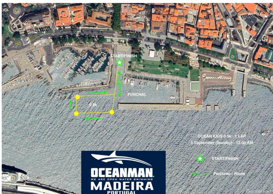
Imagem 6. Croqui – 0,5K (500 metros) OCEANKIDS