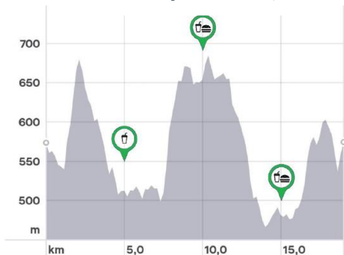
TL20 – Trail 20km e D+ 685 UT/MD 1