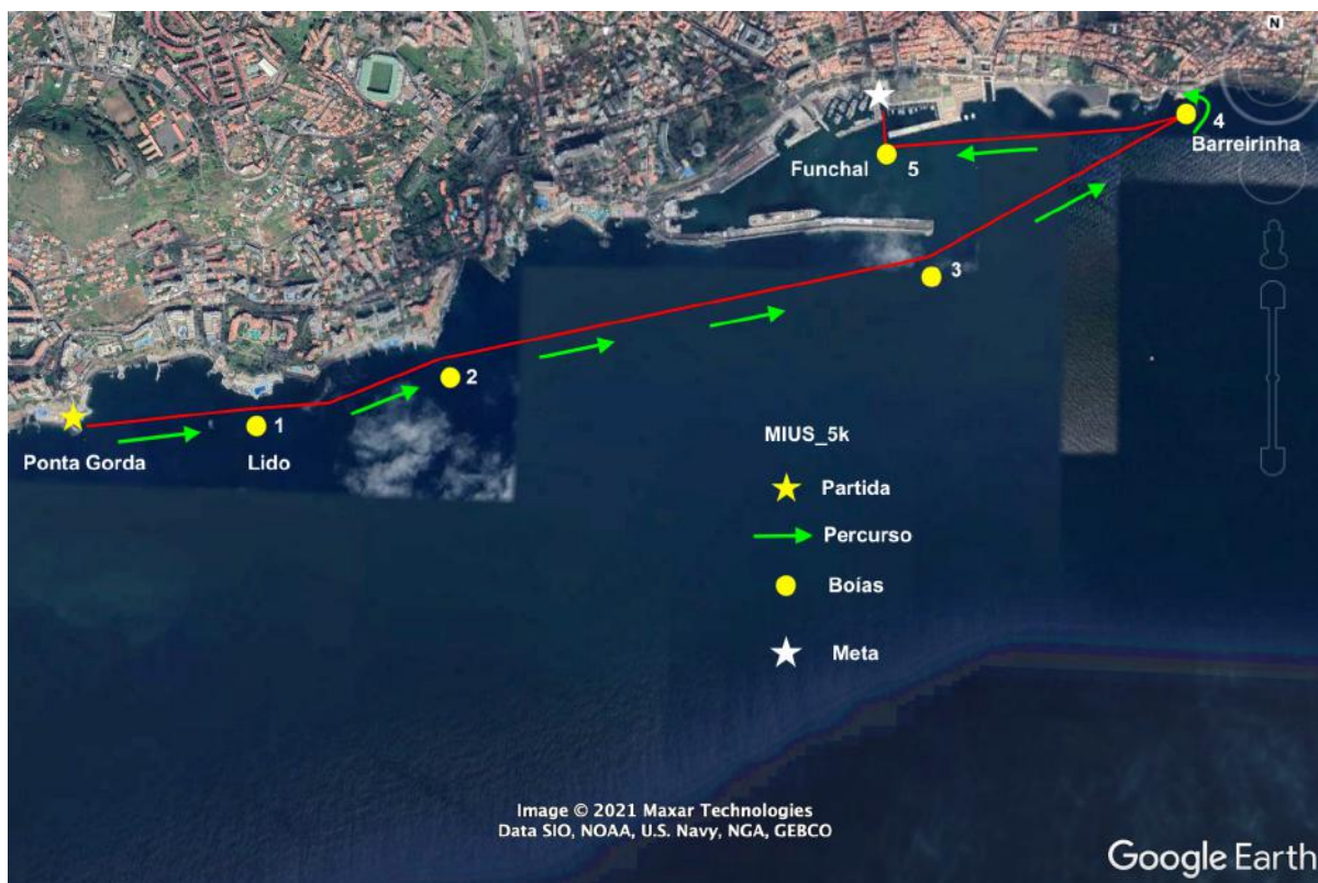
Figura 4: MIUS®_5K_Ponta Gorda/Funchal