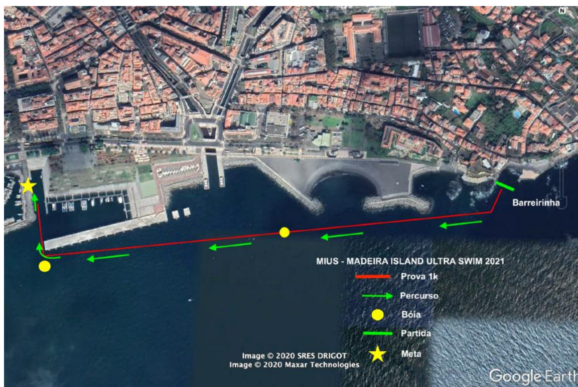
Figura 6: MIUS®_1.25K_Barreirinha/Cais Funchal