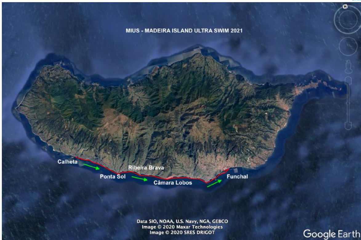
Figura 1: MIUS® - Madeira Island Ultra Swim®