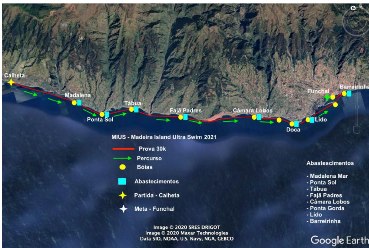
Figura 2: MIUS® _30K_Calheta/Funchal