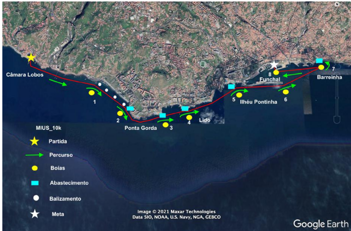
Figura 3: MIUS®_10K_Câmara Lobos/Funchal