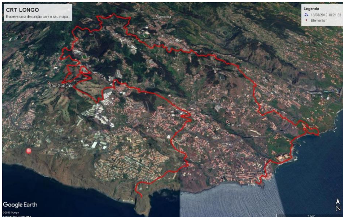
Fig. 2 - CRT Longo